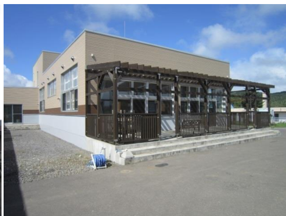
地域交流ホーム（裏手）