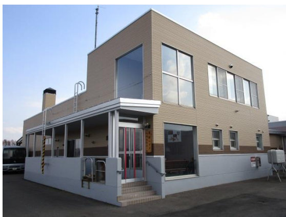
地域交流ホーム（正面）

http://yotei-heights.com/%e5%b9%b3%e6%88%9027%e5%b9%b4%e5%ba%a6%e5%85%ac%e7%9b%8a%e8%b2%a1%e5%9b%a3%e6%b3%95%e4%ba%ba%ef%bd%8a%ef%bd%8b%ef%bd%81%e7%ab%b6%e8%bc%aa%e8%a3%9c%e5%8a%a9%e4%ba%8b%e6%a5%ad%e5%ae%8c%e4%ba%86%e3%81%ae/