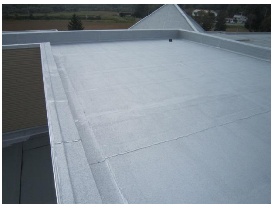
地域交流ホーム（屋上）